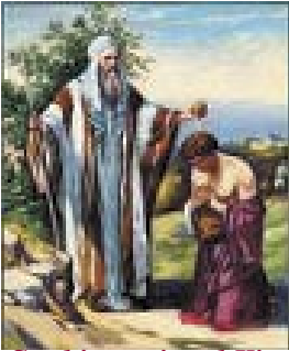
Saul is anointed King.

The use of animals’ blood in rites of both purification and consecration indicates that the persons cleansed or consecrated with the blood received new life.