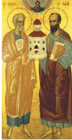
Peter and Paul

Therefore it is clear that despite its origins in the East, Christianity is not to be limited to those of a particular background, be that religious, ethnic, racial, geographical or national. It is universal, i.e., catholic. St. Ignatius of Antioch in c. viii of his letter to the Smyrnaeans (second century CE) used the Greek adjective katholikos to describe the universality of Christianity. The teachings of Christ are for people of all times and places.